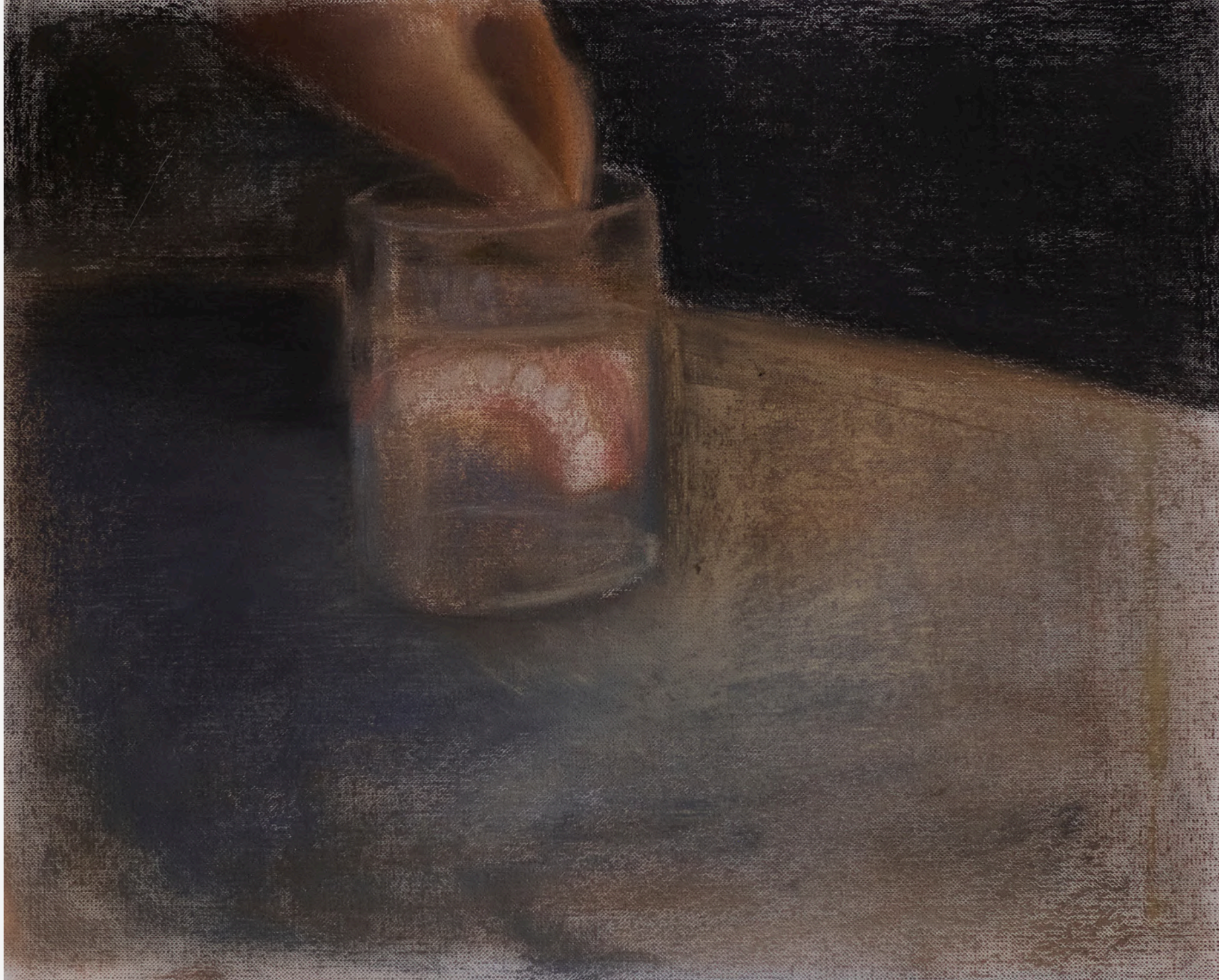
Dişler Hep Hayatta Kalıyor / Teeth Always Survive, 2023 32 x 38 cm, Framed Kağıt Üzeri Toz Pastel / Soft Pastel On Paper