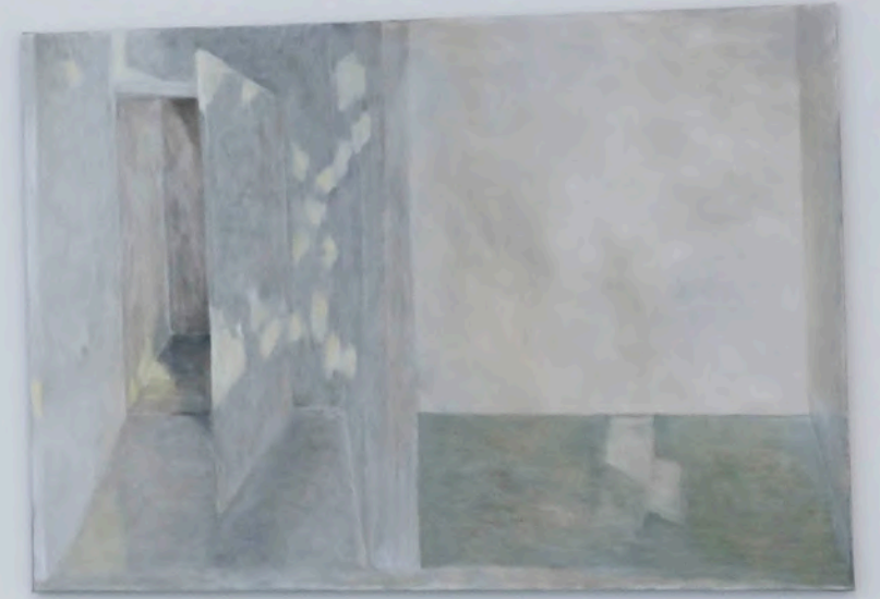
mounted, 2024, İMÇ5533