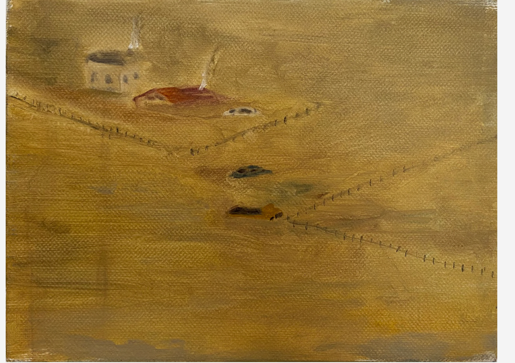
İsimsiz / Untitled, 2023 18 x 24 cm