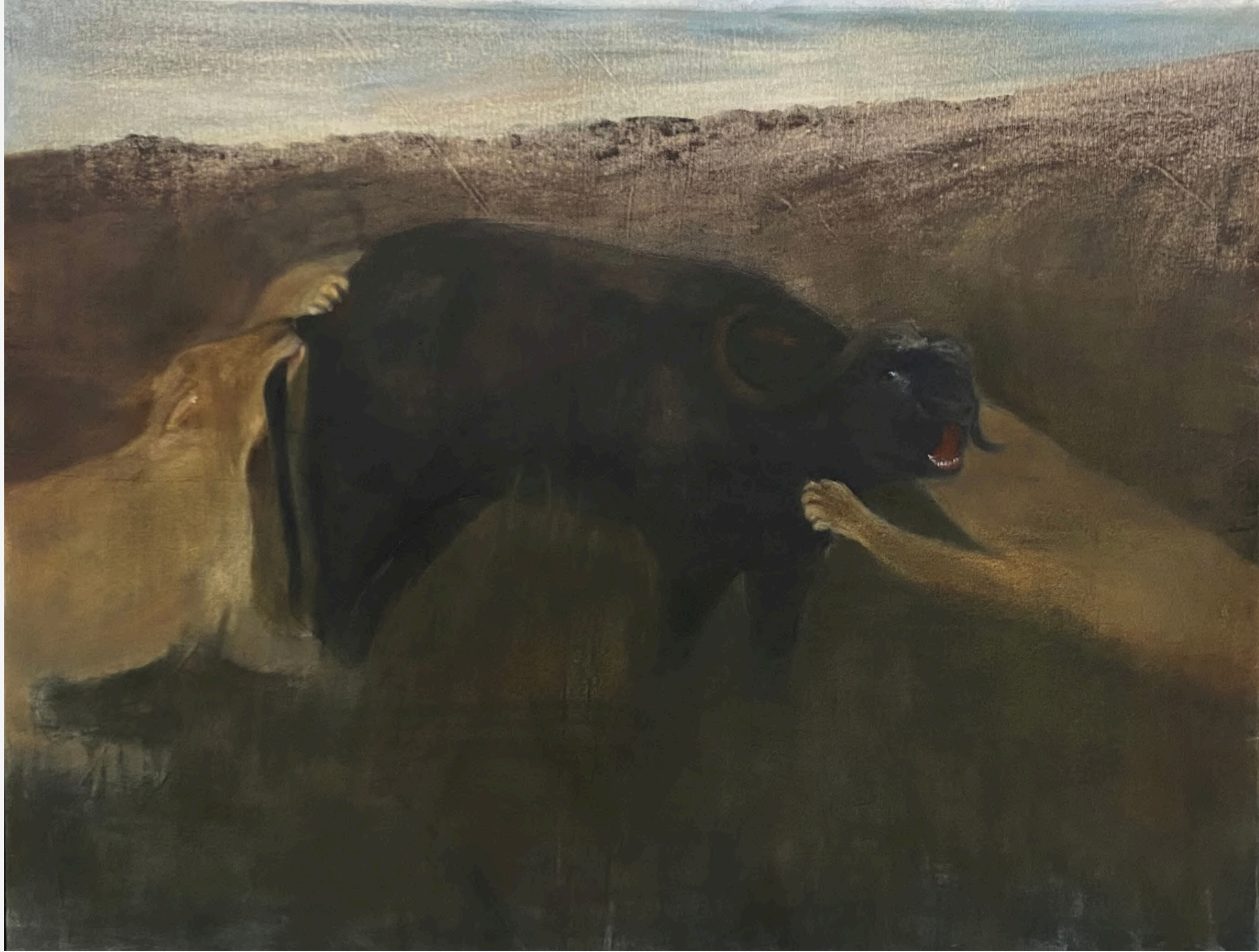
İsimsiz / Untitled, 2023 83 x 108 cm, Framed