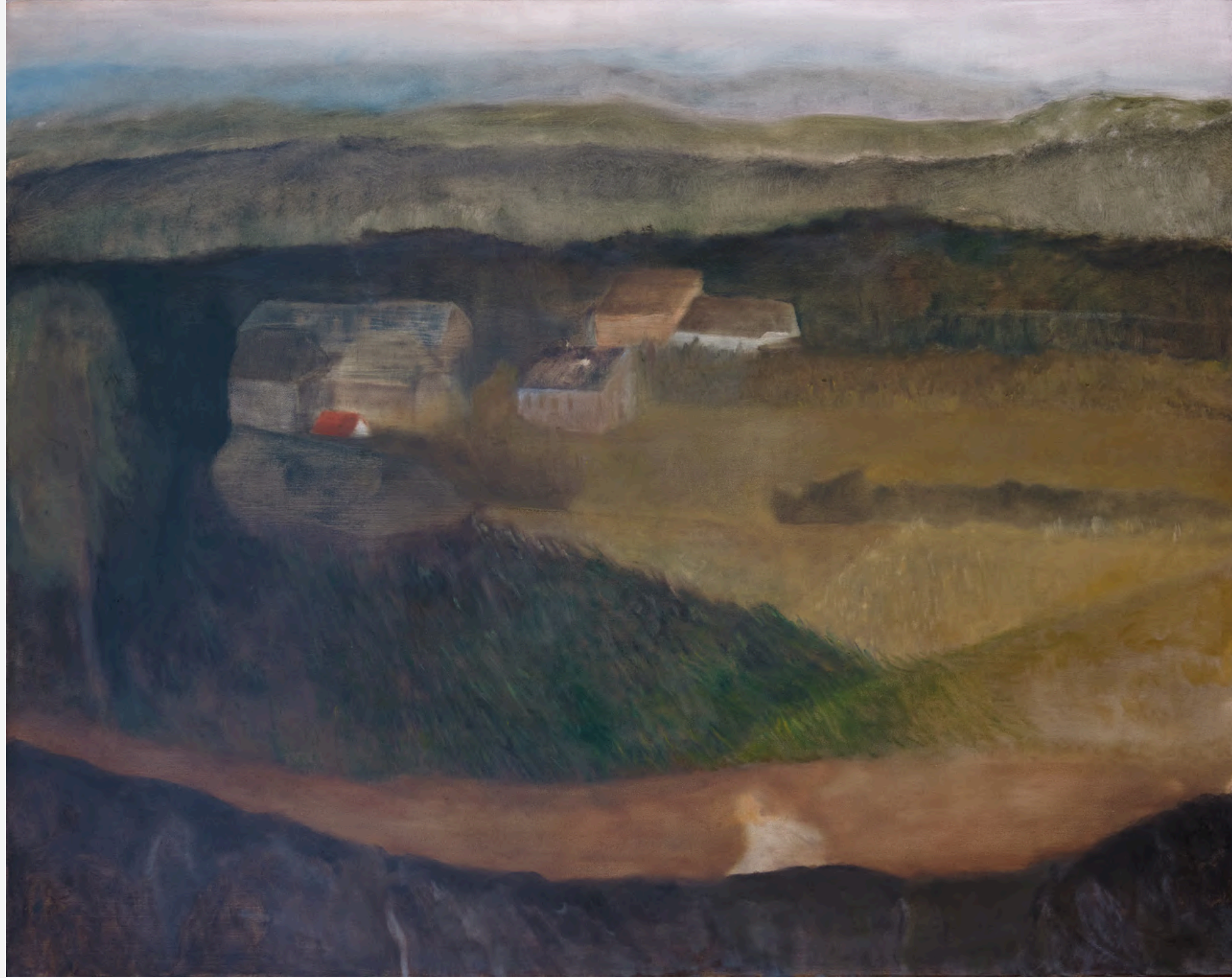
Geceleri Dağların Ötesinde Siyah Gökyüzünü Seyrediyorduk / We Were Watching Black Sky Beyond the Mountains at Night, 2023 75 x 94 cm, Framed Tuval Üzeri Yağlı Boya / Oil on Canvas