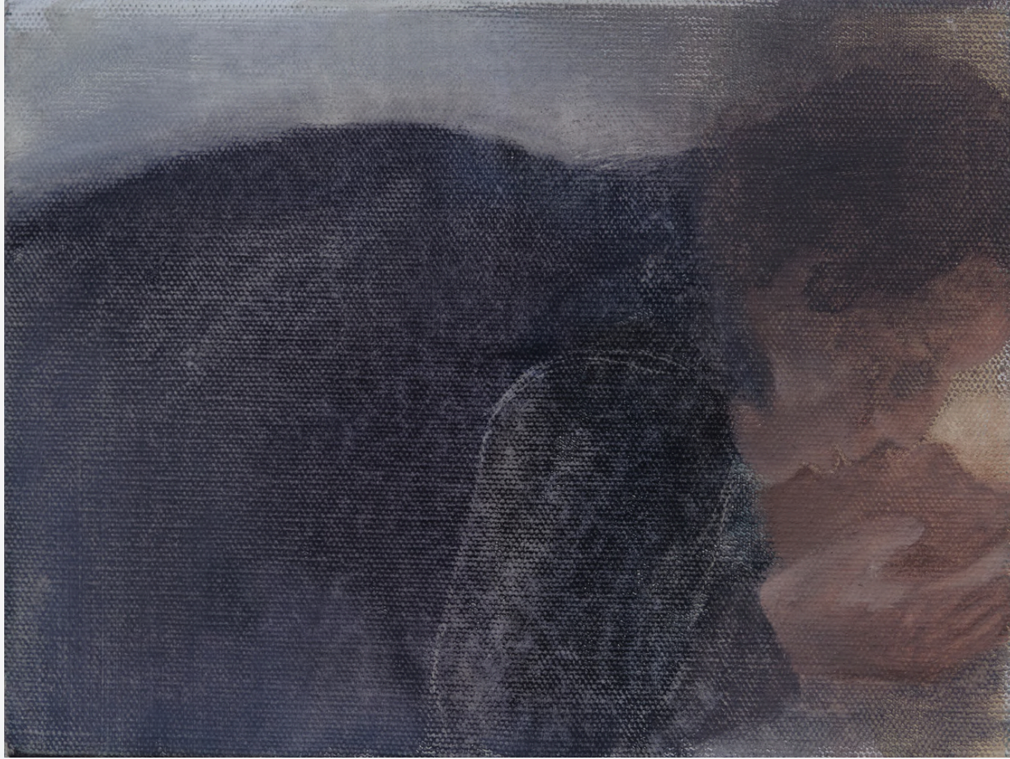
Hayat Öpücüğü / The Kiss Of Life 2023 18 x 24 cm Tuval Üzeri Yağlı Boya / Oil On Canvas