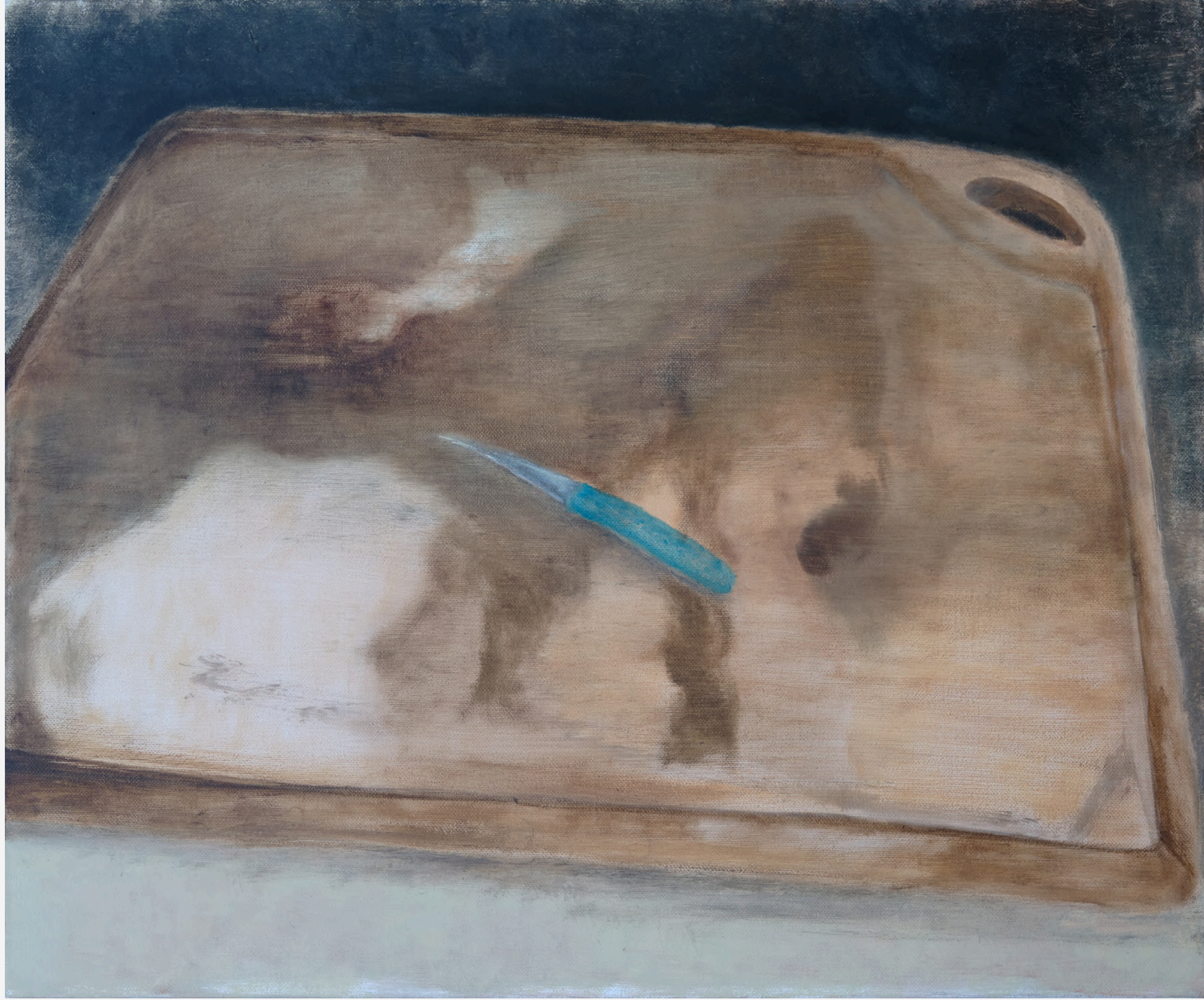
Seninle Beni Buluşturan Anın Resmi / The Painting Of The Moment We Met 2023