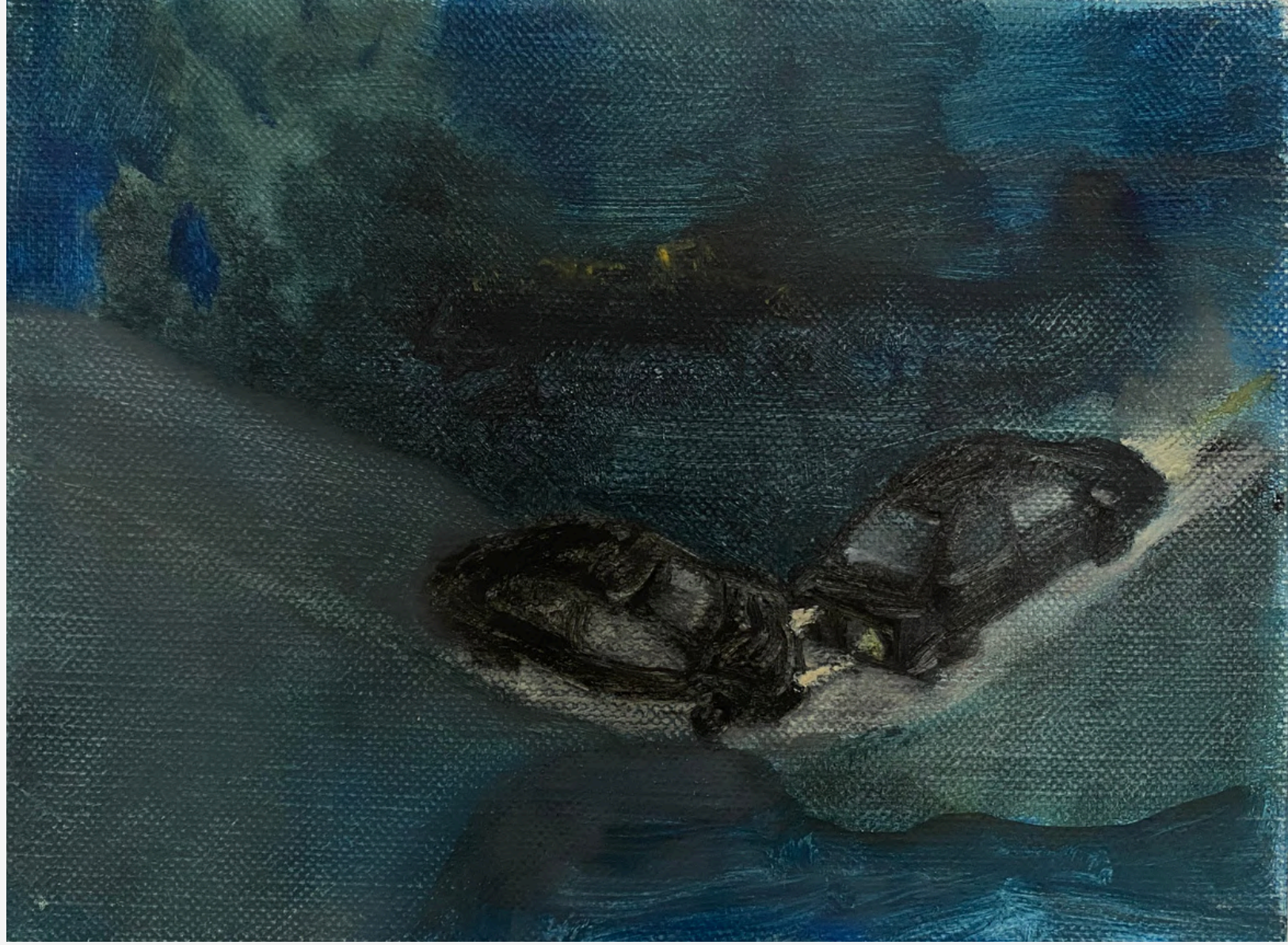
İsimsiz / Untitled, 2023 18 x 24 cm