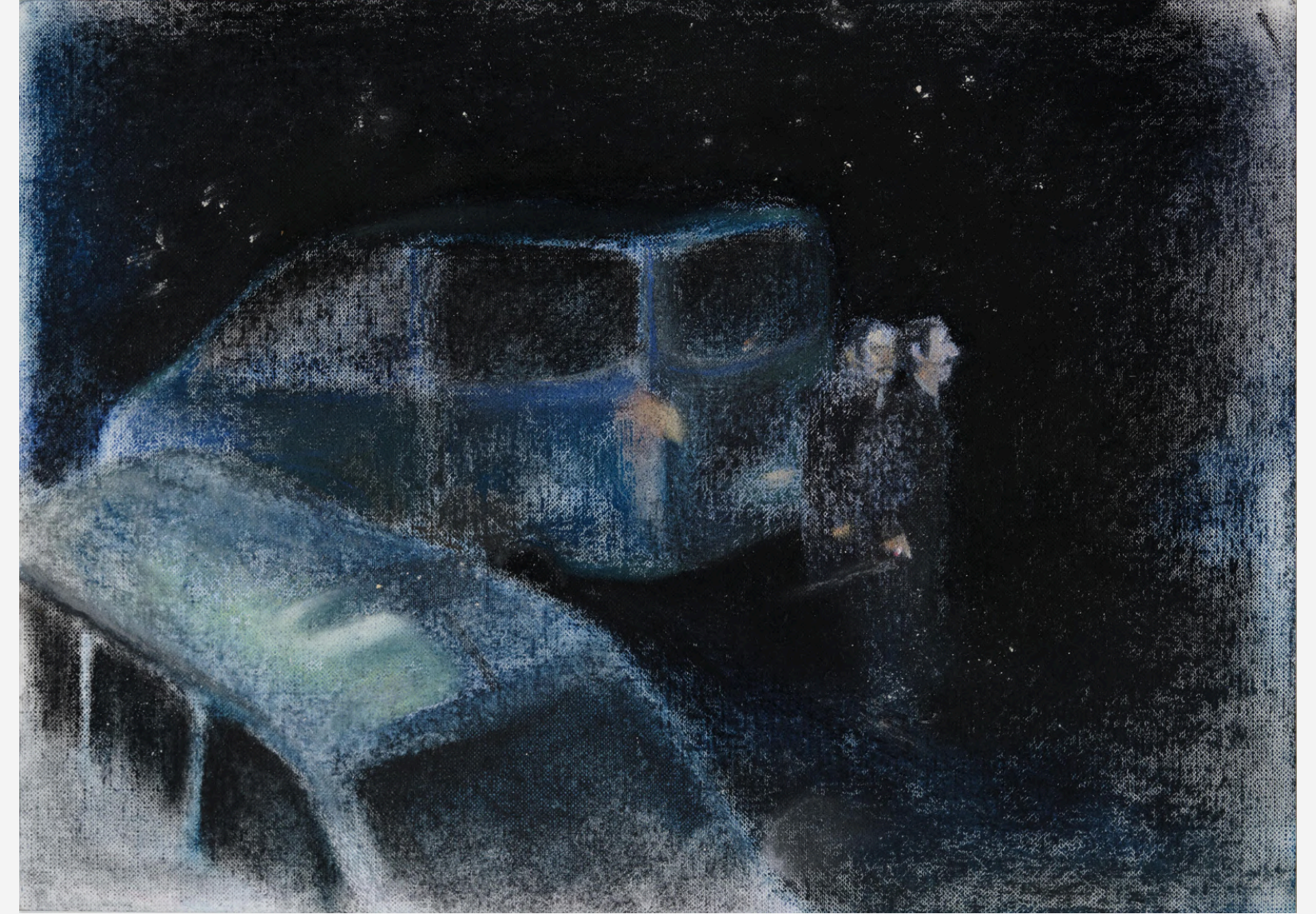
Yarım Kalan Öfkeler / Unfinished Rage, 2023 27,5 x 37,5 cm, Framed

Kağıt Üzeri Toz Pastel / Soft Pastel On Paper