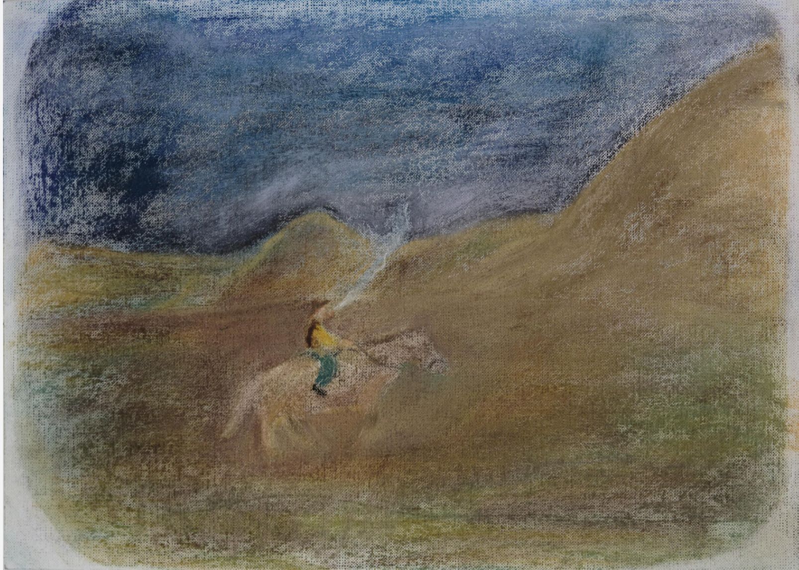
Don Quijote Şövalyeliği Bırakıyor / Don Quijote Quits Knighthood 2023