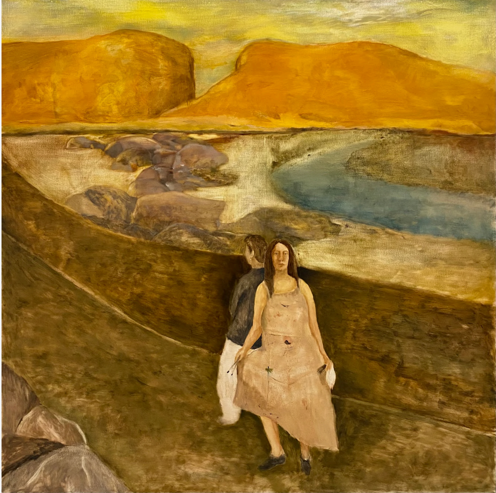
Artık Ardımızdan Geleceksiniz / Now You Will Come After Us, 2023 100 x 100 cm