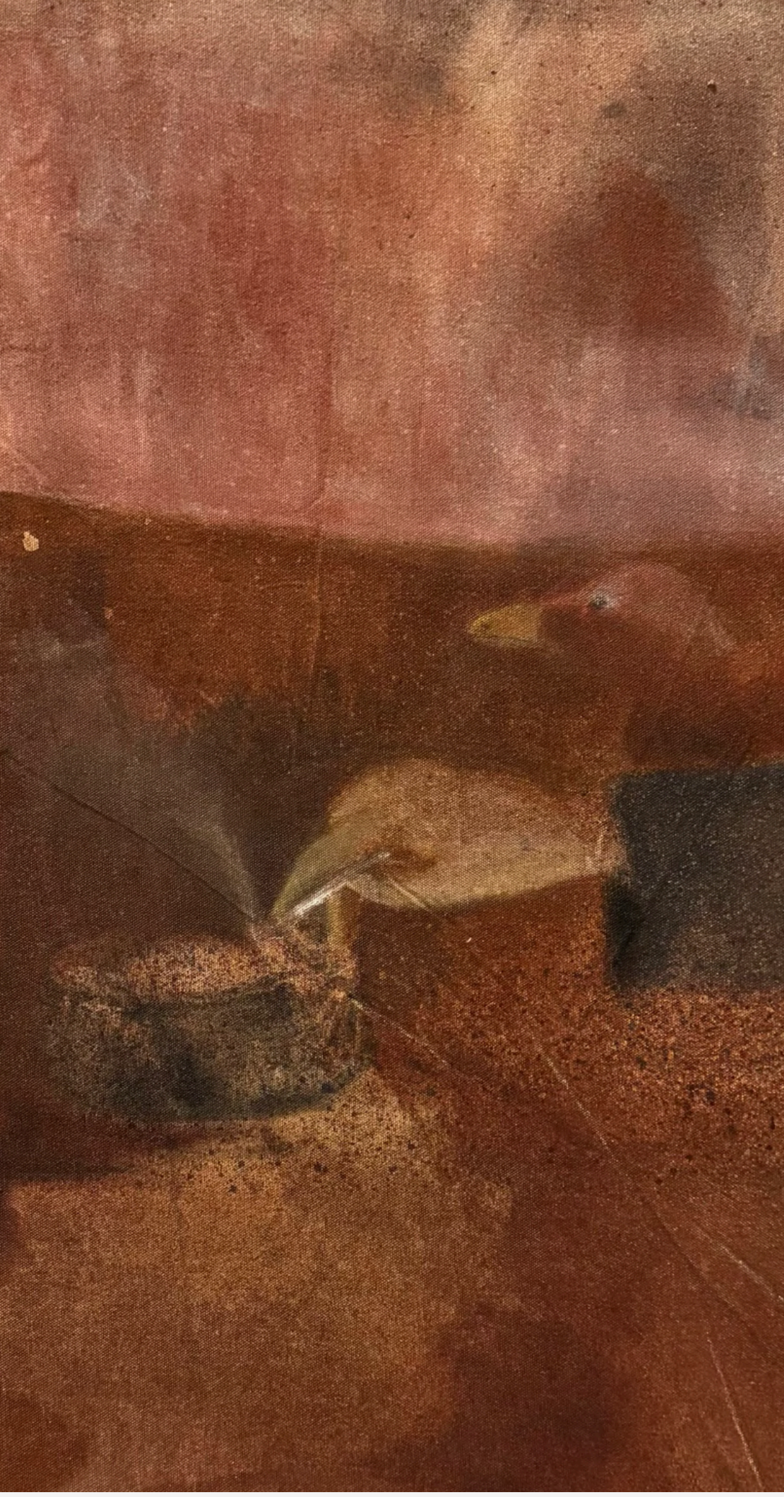
Çatlak / Crack, 2022 82 x 91 cm, Framed Tuval Üzeri Yağlı & Guaj Boya / Oil & Gouache on Canvas