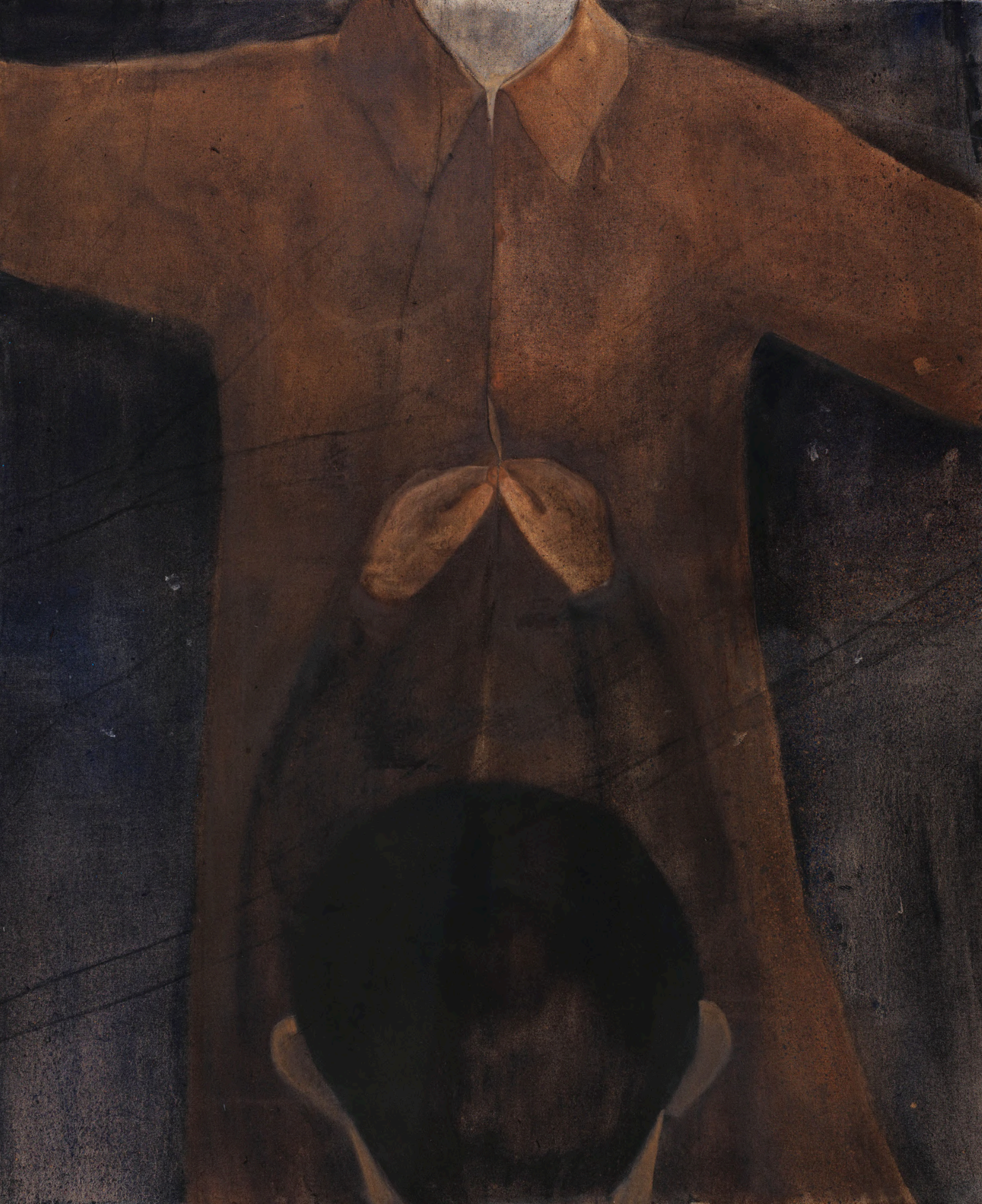
İsimsiz / Untitled, 2022 97 x 130 cm Tuval Üzeri Yağlı Boya/ Oil on Canvas