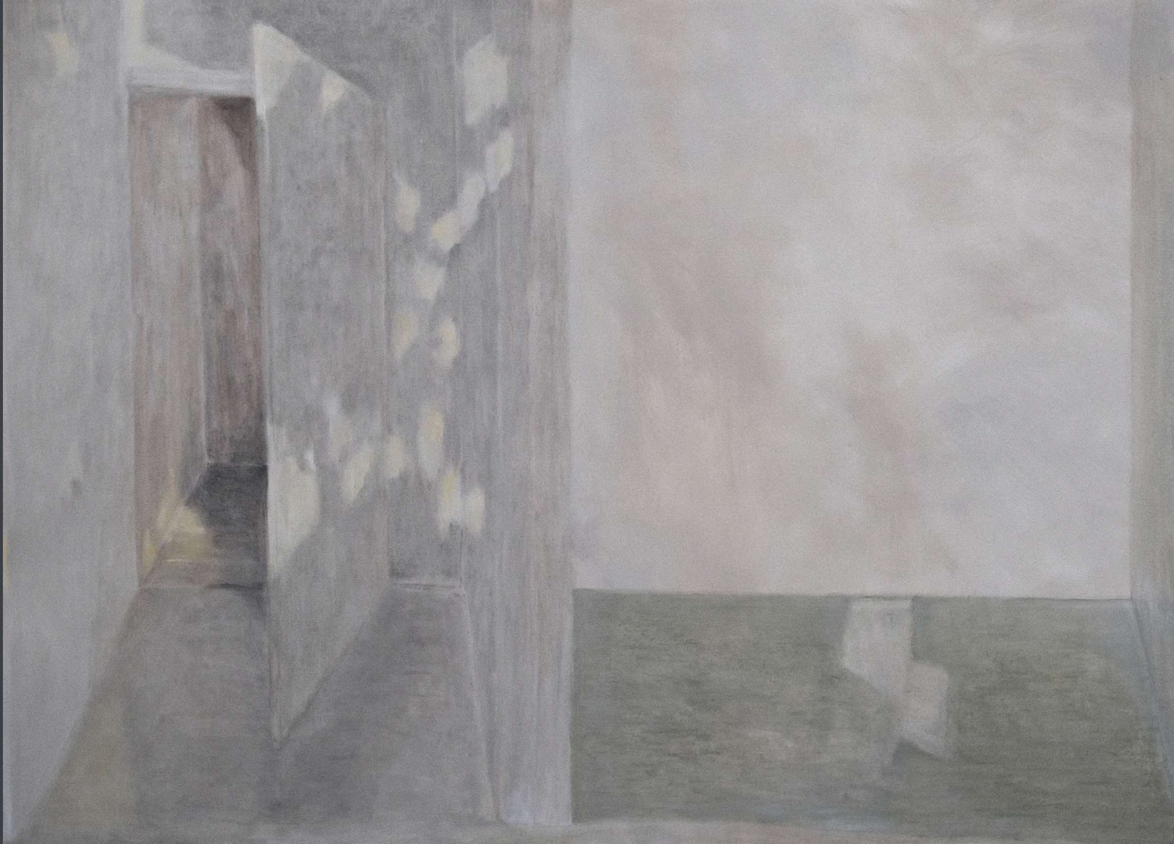
Yatan / Yalan Söyleyen Işık / / The Lying Light, 2024 80 x 110 cm Tuval Üzeri Yağlı Boya / Oil on Canvas